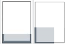
1/4 SEITE QUER ODER ECKFELD