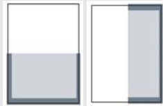
1/2 SEITE QUER ODER HOCH