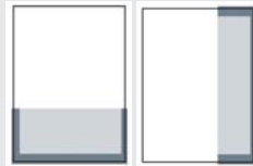
1/3 SEITE QUER ODER HOCH